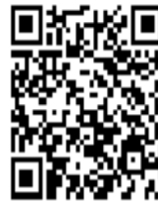
REGISTRO EN ESPAÑOL

BAPTISM +7 YEARS FIRST COMMUNION CONFIRMATION